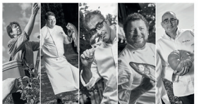
Un événement social à Genève.

Basle est une ville célèbre pour ses horloges. C'est une ville qui a une longue tradition horlogère. Basle est une ville célèbre pour ses horloges. C'est une ville qui a une longue tradition horlogère.