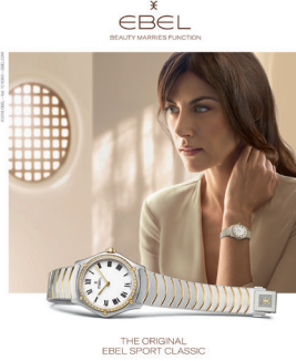
THE ORIGINAL EBEL SPORT CLASSIC

Mise en scène d'un événement mondain ayant marqué la Suisse romande